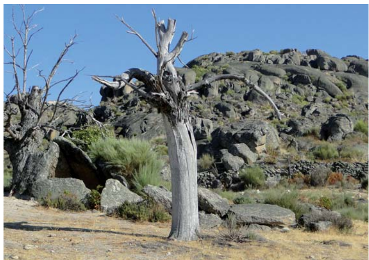
► Dolmen Data II. Die Grabkammer ist durch die herunter gefallene Deckplatte markiert, weitere Steinplatten liegen vor der Grabkammer